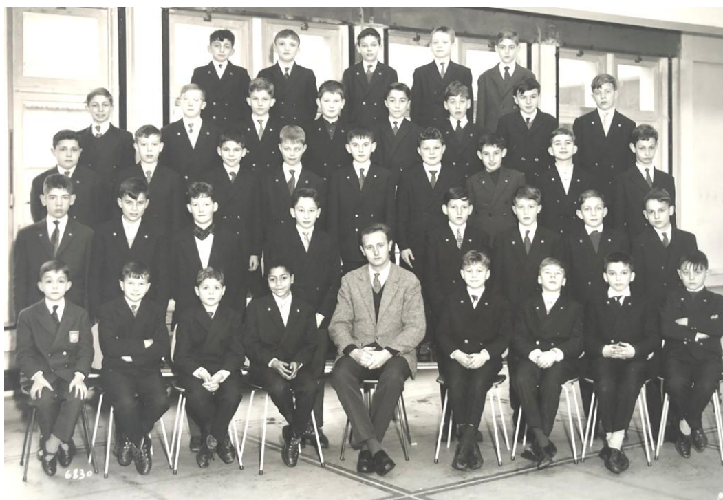
ANNÉE SCOLAIRE 1963 1964

Voilà les valeurs qu'il nous transmet, à nous, génération nouvelle. A ce jour, il est chef d'entreprise depuis 1976, reconnu dans notre métier comme le plus petit des plus grands, résistant aux grands groupes, indépendant à 100%, propriétaire de toutes ses bases. A 70 ans, toujours en polo Lacoste, été comme hiver.