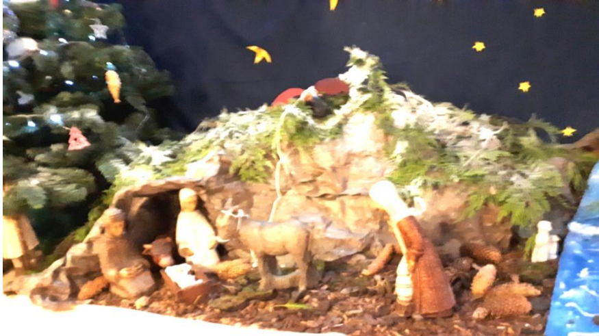
La crèche dans le hall de l'établissement

Association des Amis de La Salle-St-Nicolas 19 rue Victor Hugo 92130 Issy-les-Mx association.anciens@saint-nicolas.org